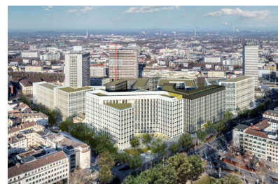
innogy SE, Essen