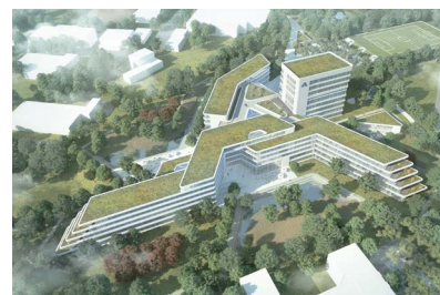
ALDI Nord Campus, Essen