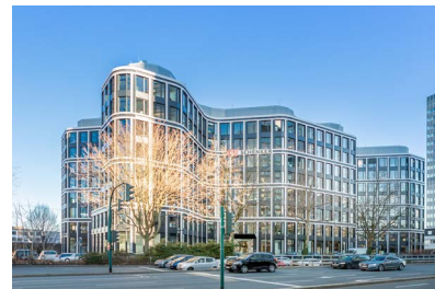
DB Schenker Firmenzentrale, Essen

Bilder-Download: www.baid.de/presselugin.html